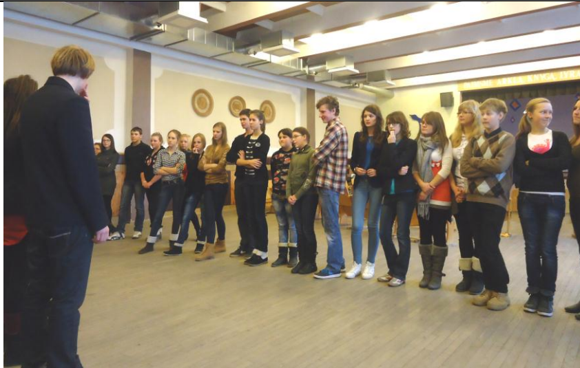
Mokinių tarybos narių viešnage Kuršėnų L.Ivinskio gimnazijoje