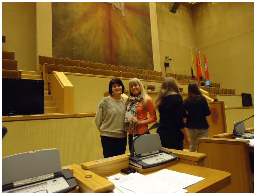
Vilniuje per LMP rinkimus