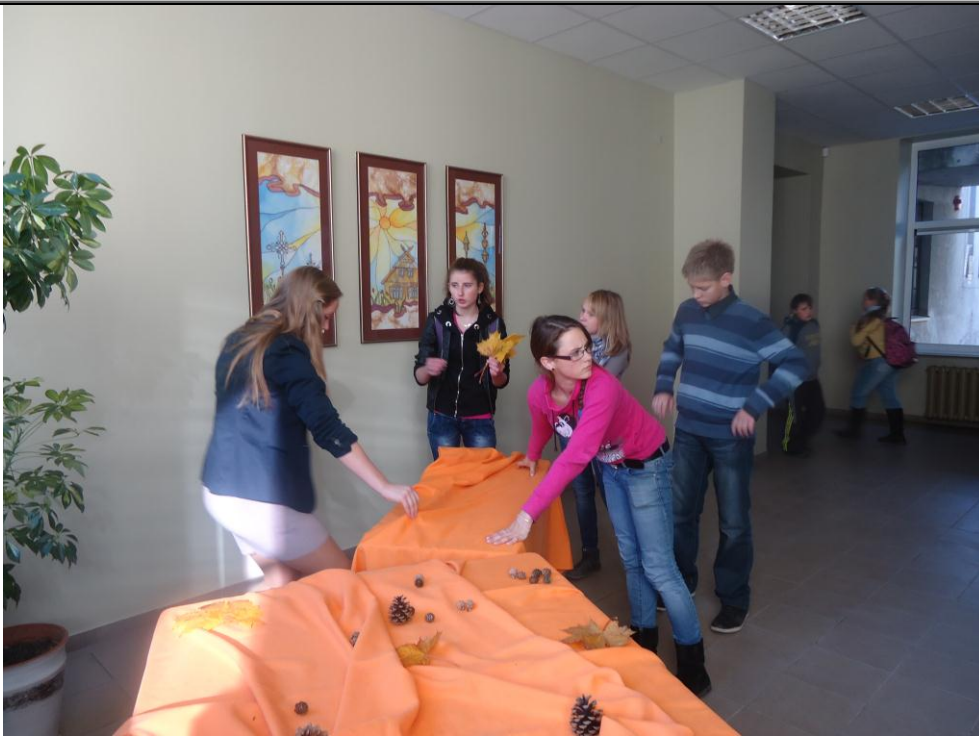
Rengiame parodą „Rudens avangardas“