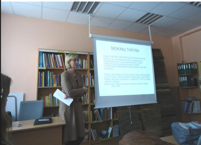
Dalyvavimas forume „Atstovavimas mokiniams ir mokyklai“